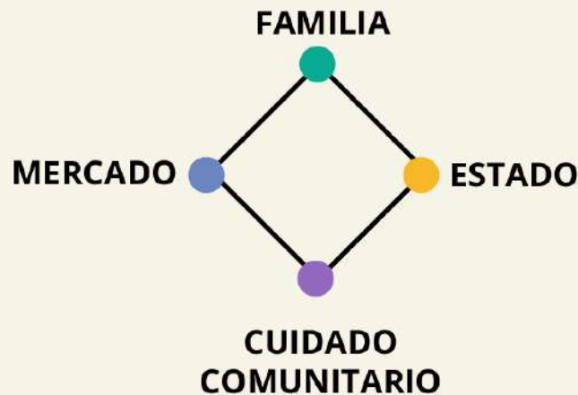
Diamante del cuidado.

Esta OSC se puede visualizar como un diamante de cuidado .