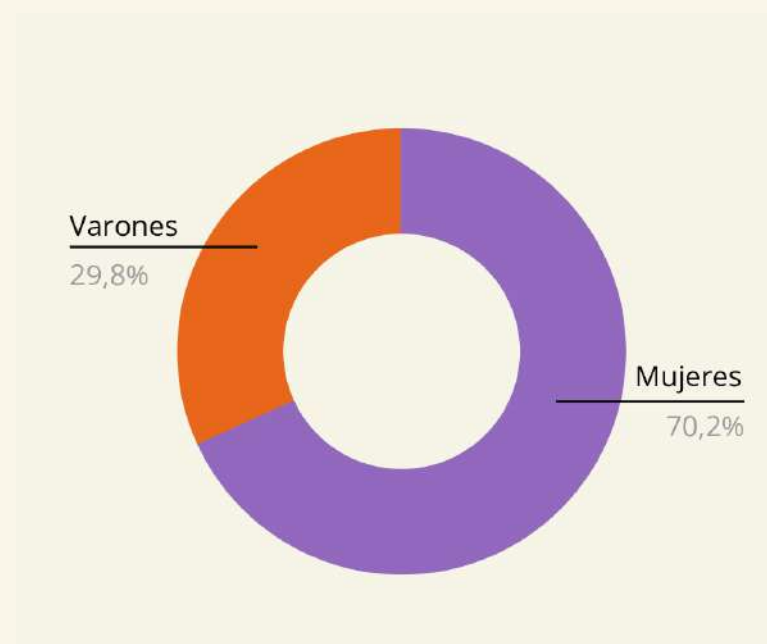
Figura 2. Distribución porcentual del tiempo dedicado al Trabajo No Remunerado (TNR).

Por la ya mencionada división sexual del trabajo, esta doble carga se asigna principalmente a las mujeres, quitándoles tiempo para su inserción al mercado laboral. La triple jornada laboral refiere al desarrollo de actividades no remuneradas por mujeres y disidencias que participan en organizaciones sociales y políticas (Broggi, 2019). Por ejemplo, los cuidados comunitarios y la participación en movimientos sociales muchas veces organizados y liderados por mujeres.